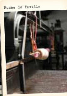
Musée du Textile