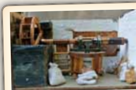
«Boîte automate» du meunier.