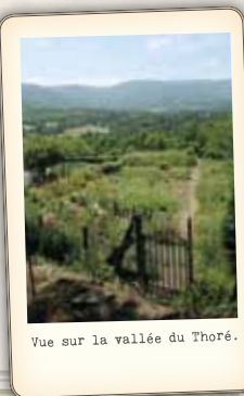
Vue sur la vallée du Thoré.

ÉCRIRE des lettres d'amour, batifoler. DÉCOUVRIR le savoir-faire textile et les pratiques rurales d'autrefois. ÉCOUTER des histoires de fils de laine et d'engrenages. CONTEMPLER la beauté des paysages forestiers du Haut-Languedoc. APPRENDRE à dessiner et découvrir la nature.