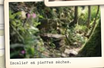
Escalier en pierres sèches.