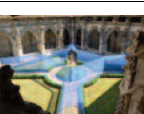
Voies Fleuries Aelien Yoyok

Programme complet des formations sur le site www.cinefeuille.com • Infos : tél. : 05 63 47 72 90